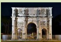
Arco di Costantino 315 d. C.