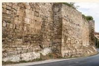
Mura serviane. IV sec. a. C.