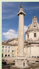
Colonna Traiana. II sec. d. C.