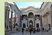
Palazzo di Diocleziano a Spalato. 293-305 d.C.