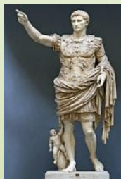
Augusto di Prima Porta. I sec. d.C.