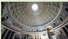
Pantheon, 113-124 d.C., Roma