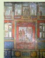
Casa dei Vettii. I sec. a. C. Pompei.