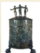
Cista Ficoroni. IV sec. a. C. ca.