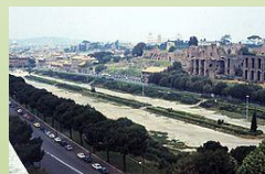
Circo Massimo, I sec. d. C.