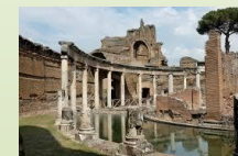
Villa Adriana a Tivoli. II sec. d. C.