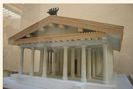
Tempio della Triade Capitolina.