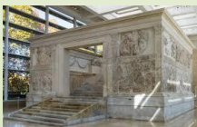
Ara Pacis, I sec. a. C.