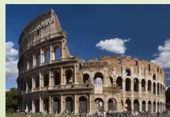
Anfiteatro Flavio. 72 d. C.