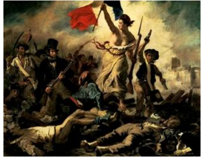
La Libertà che guida il popolo. 1830. Olio su tela. Parigi, Louvre

Quadro-simbolo del Romanticismo, rinvia alla rivolta parigina del 1830 . Compagno tutti i ceti sociali, esortati dalla donna con la bandiera, allegoria della Libertà. La piramide compositiva sembra rovesciarsi in avanti, investendo lo spettatore con l'avanzare dei personaggi. I contrast i di luce/ombra, le macchie di colore, il senso di caos e il realismo dei dettagli esaltano l'effetto drammatico.