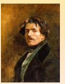
Autoritratto. 1837. Parigi, Louvre

Tra i massimi protagonisti del Romanticismo francese, nacque in una famiglia benestante a Charenton-Saint Maurice nel 1798. Ebbe una formazione classica e fu allievo di Pierre-Narcisse Guérin . Sia lo studio delle opere del Louvre, sia l'influenza di Géricault furono decisivi per il suo orientamento espressivo. Componenti fondamentali del suo stile sono il colore, il dinamismo, l'accento drammatico e la continua sperimentazione sui colori. I viaggi in nord-Africa e in Spagna alimentarono il suo interesse per l'esotismo. Morì a Parigi nel 1863.