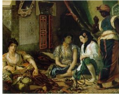
Donne di Algeri nei loro appartamenti. 1834. Olio su tela. Parigi, Louvre

In questo interno domestico dal fascino esotico si respira un clima di calma e sensualità. Le quattro donne, assortite in un dialogo pacato vivono un momento di relax. Nella perfetta combinazione di toni colorati Delacroix sperimenta il gioco dei riflessi, ottenendo effetti di luminosità che preannunciano l'impressionismo. L'opera è frutto dei suoi viaggi in Nord-Africa.