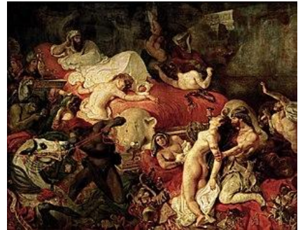
La morte di Sardanapalo. 1827. Olio su tela. Parigi, Louvre

Si riferisce alla strage voluta dal re assiro Sardanapalo, insieme al suo suicidio. L'atmosfera incandescente della tragedia è resa con un cromatismo di rossi e gialli . Il forte dinamismo segue un ritmo concitato. La composizione diagonale e lo sbilanciamento verso il basso, suscitano l'effetto di una colata lavica.