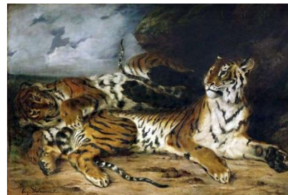
Giovane tigre che gioca con la madre. 1830. Olio su tela. Parigi, Louvre

L' interesse per gli animali rinvia agli studi naturalistici dell'800. La situazione rilassata e la serena spontaneità delle tigri, in contrasto con il cielo burrascoso sullo sfondo, allude alla forza e imprevedibilità della natura .