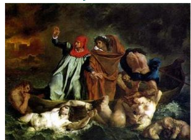
Dante e Virgilio all'Inferno. 1822. Olio su tela. Parigi, Louvre

La visione sinistra della palude infernale con gli iracondi che si mordono a vicenda è un ambiente tenebroso con lampi di luce spettrali. La composizione a piramide sembra sciogliersi tra i movimenti convulsi e le macchie di colore . I nudi si ispirano a quelli di Michelangelo.