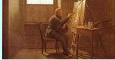
Georg Friedrich Kersting C. D. Friedrich nel suo atelier. 1811. Dett.

Nasce a Greisfward .nel 1774 da famiglia borghese. Infanzia segnata da gravi lutti. Si dedica a studi di filosofia, teologia e poesia . Studia pittura all'Accademia di Copenaghen. Si trasferisce a Dresda dal 1771 dove vive e lavora fino alla sua morte, nel 1840 .