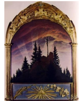
Croce in montagna. 1807-08

Pini e composizione triangolare e simmetrica ricordano le cattedrali gotiche . La Natura è un linguaggio cifrato con cui Dio parla agli uomini.