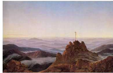
Mattino sul Riesengebirge. 1810-11

Centrale nella sua opera è il senso dell'Infinito