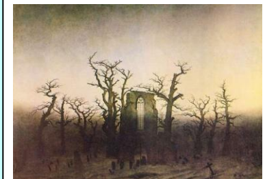
Abbazia nel querceto. 1809-10

E' suggestiva la carica spirituale e il senso di sospensione.