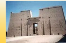
Esempio di mastaba a Saqqara

Antico regno Primo periodo di fioritura . Si costruiscono le piramidi e le grandi necropoli . Ai rilievi scultorei si affiancano statue monumentali con forme molto idealizzate . Tombe e mastabe sono decorate con rilievi dipinti e cicli pittorici .