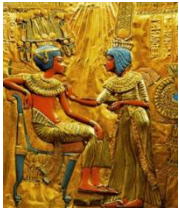
Trono segreto di Tutankhamon, XIV sec. a. C. Il Cairo, Museo Egizio

Si sviluppa per oltre 3.000 anni con un carattere unitario e una straordinaria continuità , con rispetto delle tradizioni, ripetizione di schemi e forme. Ciò è dovuto: all' isolamento culturale dell'Egitto rispetto agli altri popoli; alla situazione statica politicamente (potere assoluto concentrato in un re o faraone); allo stretto legame tra arte e religione .