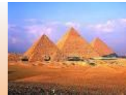
Necropoli di Giza. III millennio a. C.

Antico regno Primo periodo di fioritura . Si costruiscono le piramidi e le grandi necropoli . Ai rilievi scultorei si affiancano statue monumentali con forme molto idealizzate . Tombe e mastabe sono decorate con rilievi dipinti e cicli pittorici .