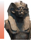
Statua di Sesostris III 1879-46 a. C. Londra, British Museum

Medio Regno, Capitale Tebe. Dalla XI alla XII dinastia. Primi templi funerari e tombe rupestri . Nella scultura le statue dei faraoni hanno tratti più somiglianti e si realizzano le sfini . In pittura si dipingono rilievi bassissimi con una vasta gamma cromatica. Importanti esempi nell' oreficeria .