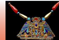
Pettorale della principessa Sithathoriunet

Secondo periodo intermedio. caratterizzata da lotte interne nello Stato e dall'invasione degli Hyksos. Va dalla XIII alla XVII dinastia.