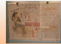
Rilievo dipinto di Nefertabet, 2600 a.C. ca. Parigi, Louvre

Primo periodo intermedio. Dal 2160 a.C. al 2055 a.C., va dalla VII alla X dinastia.. E' segnato da continue lotte interne