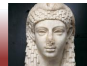
Ritratto di regina. Età tolemaica. Roma, Musei Capitolini.

Periodo finale in cui si susseguono l'Età tarda, l'età tolemaica e l'età romana. L'arte riflette nuove ideologie politiche-religiose con qualche influenza greca (periodo tolemaico) e ripetizione di forme tradizionali egizie specialmente nei templi e nella scultura.