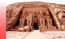
Grande Tempio, Abu Simbel

Terzo periodo intermedio. Dalla XXI alla XXV dinastia. Progressiva frantumazione del potere e conflitti interni.