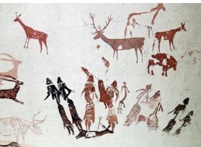
Dipinti dalla grotta Moros, mostra al Museo Archeologico di Gavà. Barcellona.

Le scene si organizzano in composizioni più complesse. Si rappresentano uomini e animali in scene di caccia e momenti di vita sociale. Lo stile si allontana dal naturalismo paleolitico, le forme sono più astratte, stilizzate ed eleganti. I colori sono accesi e accostati a contrasto.