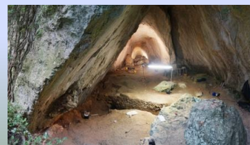
Sepoltura della neonata Neve. Grotta di Arma Veirana. Albenga

I defunti venivano seppelliti per inumazione in fosse circondate da un corredo funebre. Alcune sepolture sono ricavate da grotte naturali modificate dall'uomo.