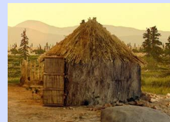
Ricostruzione di capanna preistorica

Erano le abitazioni più diffuse nelle aree con clima mite e caldo. Di forma rettangolare o circolare, erano sorrette da una struttura di pali ricavati da fusti di piante e rami intrecciati. Erano rivestite di fronde, pelli o fango.