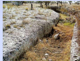
Trincea preistorica di Murgia Timone

Fosse di forma allungata, scavate nel terreno, rivestite all'interno con paglia o argilla. Avevano funzione abitativa. Erano coperte da botole di rami intrecciati. Si accedeva con scale a pioli fatte di rami legati con fibre vegetali.