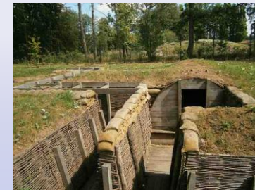
Ricostruzione di una camera seminterrata mesolitica.

In parte ipogee, sono abitazioni scavate nel terreno e coperte da tetti ottenuti con rami intrecciati e canne. Spesso erano rivestite all'interno con stuoie. Si accedeva grazie a scale a pioli.