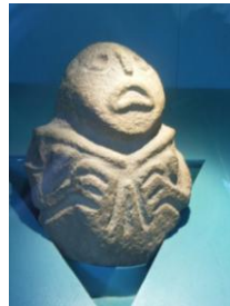
Scultura mesolitica in pietra. VIII millennio a. C. Dallo stanziamento di Lepenski Vir, Serbia.