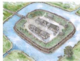
Esempio di villaggio neolitico

Le abitazioni erano disposte ordinatamente dentro ad un recinto difensivo composto da tronchi. Sorgevano su un terrapieno circondato da un canale con acqua.