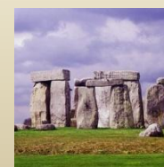
Dolmen di Sa Coveccada, Sassari

Formati da due o più menhir sorreggenti un blocco orizzontale (dolmen)