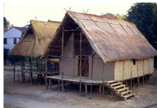
Terremare. Ricostruzione del Parco Archeologico di Montale.

Erano le tipiche abitazioni neolitiche, molto diffuse in Italia. Poggiavano su pali sostenenti pavimenti e pareti di tronchi. Erano coperte da tetti a spioventi impostati su travi. Corredate da scale e terrazzi, all'interno erano provviste di letti, culle, sedili, tavoli. Palafitte: sorgevano sull'acqua, erano raggiunte con imbarcazioni. Terremare: sorgevano sul terreno.