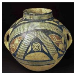
Vaso dipinto 5300-4800 ca. a. C. (tardo neolitico)

E' una delle più importanti invenzioni del Neolitico. Consiste in manufatti modellati in argilla e cotti in forni. Potevano essere decorati con incisioni o impressioni di conchiglie e semi praticate sull'argilla cruda.