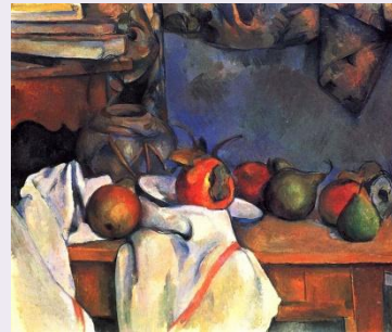
Paul Cézanne, Natura morta . 1890-93. Philips Memorial Gallery, Washington

Considera l'immagine come risultato di un'esperienza mentale. Cerca l'essenza della natura attraverso forme geometriche solide.