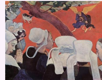
Paul Gauguin, La visione dopo il sermone . 1888. Scottish National Gallery, Edimburgo.

Le tecniche sono diverse: Gauguin usa una stesura del colore a plat. Risultano immagini visionarie e sognanti.