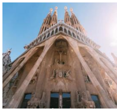
Facciata della Passione