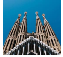
I pinnacoli con i ponti aerei