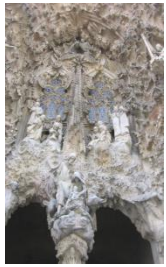
Facciata della Natività. Dett.

3 facciate (della Natività, della Passione, della Gloria) e 18 torri cilindriche (ma sono state costruite solo alcune) traforate e collegate da passaggi aerei, rivestite di mosaici e marmi policromi. Le torri si sviluppano in un succedersi di stili diversi fino ai pinnacoli cubisti.