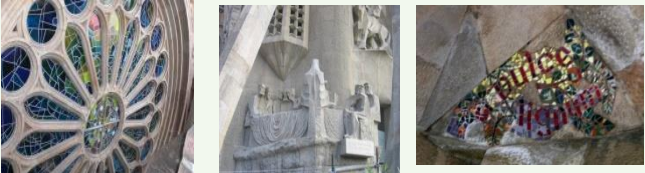
Particolari del rosone, delle sculture e dei mosaici

In un impianto strutturale slanciato ed elastico i volumi traforati sono rivestiti da mosaici e sculture che sembrano germinare sulle superfici, popolandosi di piante e creature realistiche e fantastiche. Nell'insieme Gaudì applica il principio simbolico secondo cui La retta è la linea degli uomini, la curva è la linea di Dio .