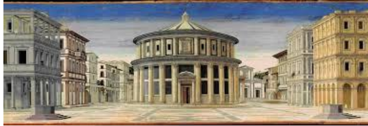
Città ideale. 1480-90. Galleria Nazionale delle Marche, Urbino

Le signorie italiane conformano le loro città a questi principi. Esempi principali: